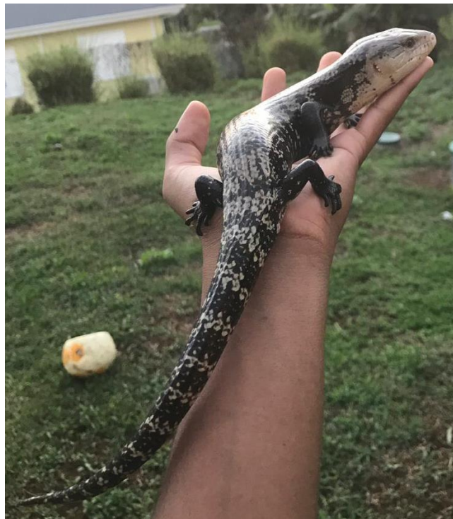
Django mâle Tiliqua gigas, âgé de 2ans